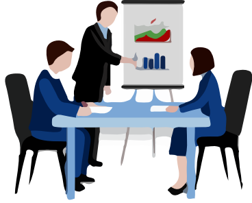
المقابلة المبنية على الكفاءة