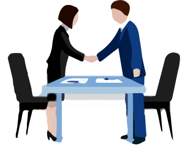
المقابلات الوظيفية بين شخصين